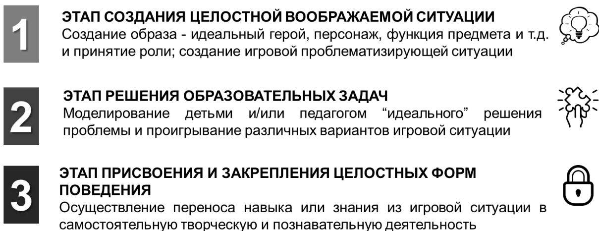
Рис. 1 Алгоритм разработки и совершенствования игровых технологий